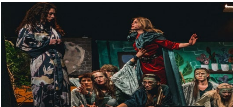
Deutsch LK Q2

Vom 19.01 bis 25.1. wurde unser Blauer Saal fünfmal vom „Grauen“ heimgesucht. Fast zwei Wochen intensives Proben und eineinhalb Jahre Vorbereitung lagen hinter uns. Auf die Aufführungen hatten wir lange hingearbeitet. Wir sind zu einer Gemeinschaft geworden und jahrgangsübergreifend zusammengewachsen. SolistInnen, Chöre, Orchester, Bigband und DS-Kurs brachten die Geschichte von Audrey, Seymour und der fleischfressenden Pflanze auf die Bühne des vom Kunst-LK völlig verwandelten Blauen Saals. Das Publikum war von den schauspielerischen und musikalischen Leistungen aller Beteiligten begeistert! Ein großer Dank gilt allen, die die Aufführungen ermöglicht haben: unseren LehrerInnen, insbesondere aus dem Musik-, DS- und Kunst-Bereich, der Maske, der Regie, dem Technik-Team und „Lichtblick Bühnentechnik“.